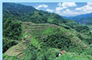
上: サシバの鷹柱を観察/中左: バナナの葉で包んで蒸したお芋のケーキ/中右: 行く先々でサシバの群れに出会います/下左: フィリピン固有種のシロボシショウビン/下右: 世界最大級の棚田、世界遺産バナウェ