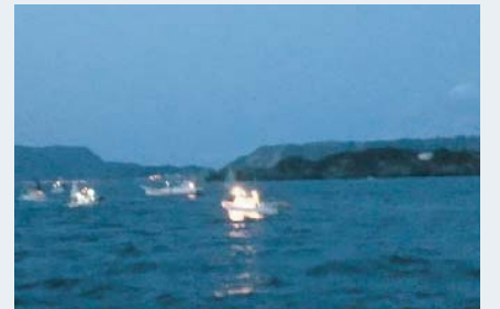
アカイカ漁の漁船に同乗し、夜間調査を実施

三宅島から約10km西の沖合にある岩礁で、三つの突岩(とつがん)が見えることから別名「三本岳(さんぼんだけ)」とも呼ばれています。1995年から毎年、三宅島自然ふれあいセンター・アカコッコ館のレンジャーを中心に周辺海域の洋上調査が行なわれています。