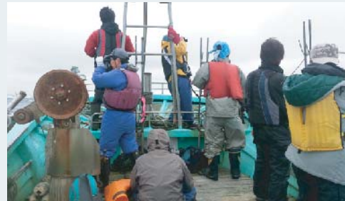
漁船の左右に分かれてカムリウミスズメを探す

8月26日、非繁殖期の生息調査を北海道東部の浜中町沖で行ないました。NPO法人エトピリカ基金の調査員6名と共同で午前9時から調査を行なった結果、5時間半で計6羽のカムリウミスズメを発見し、夏には道東に生息している個体がいることを改めて確認しました。これらの営巣地や、どのような移動経路をたどってここまで来たのかを明らかにしていくことが、今後の課題となりました。