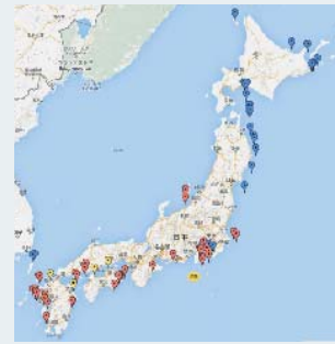
目撃情報の収集地図 (赤ピン：繁殖期・青ピン：非繁殖期)

情報はこちらへ https://www.wbsj.org/form/nature/sw/form.html