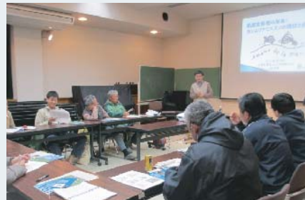
島内のエコツアー実施について話し合う