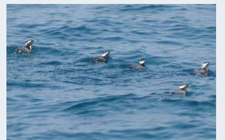
大野原島の周辺で発見した群れ