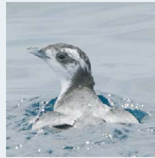
非繁殖期のカムリウミスズメ