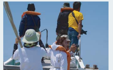
舳(へさき)で目をこらす調査員