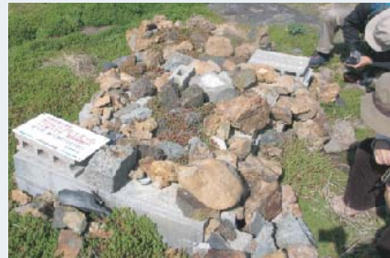
人工巣の利用の有無を確認する