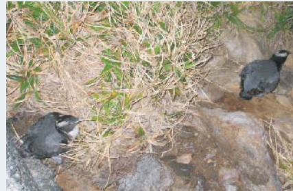
巣から出てきた成鳥

繁殖状況調査と併せて、島内2カ所に設置している人工巣の利用状況の確認を行ないましたが、2013年度も人工巣が利用された痕跡はありませんでした。今後は、繁殖状況モニタリング調査によって得た結果を参考に、人工巣の形状や設置場所に改良を加えていく予定です。