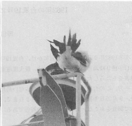
図 2 マストで羽づくろいするアカアシ カツオドリ (1979. 9. 3).