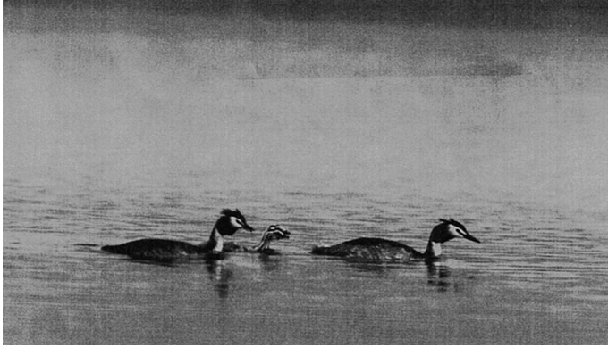
図 2. 採食を終え、五明光橋の水域に戻るカンムリカイツブリの親子(7月15日撮影)