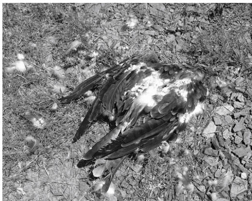
図 2. 背に大きな傷のあるトビの死体(2006年 8月 1日).

Fig. 2. A dead Black Kite with a deep gash on the back (August 1 2006).